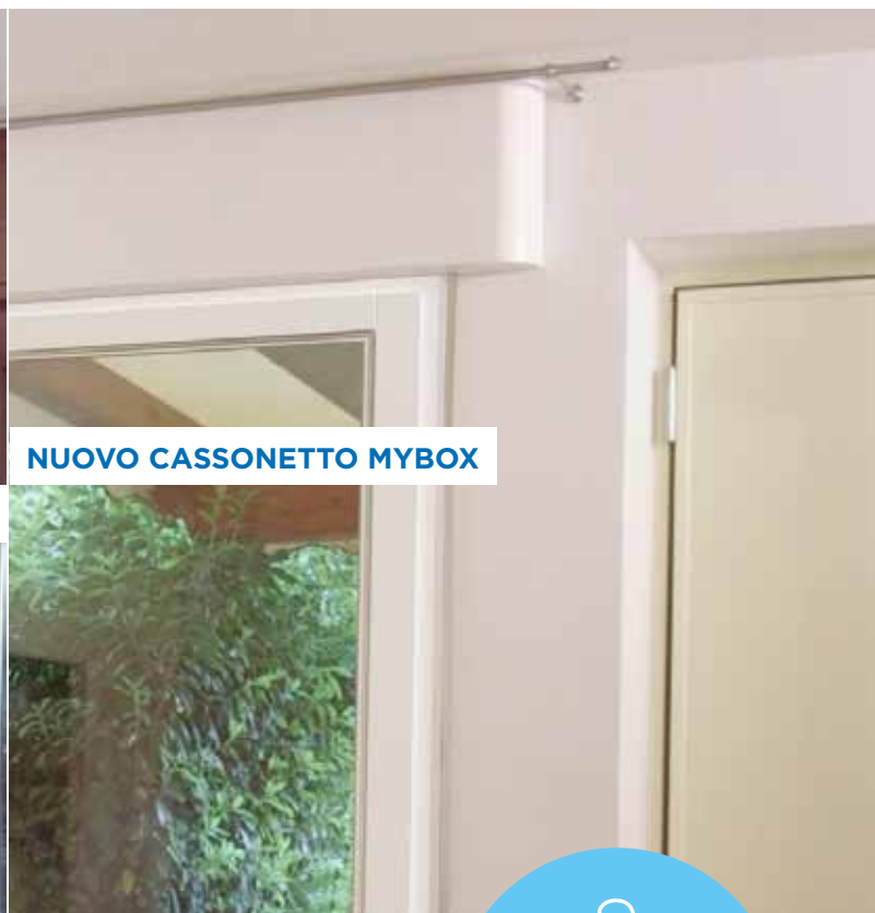
NUOVO CASSONETTO MYBOX